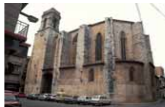
Església de Sant Lluç, a Ulldecona.

Des d'aquests abrics podem imaginar aquells habitants prehistòrics dominant la vall a recer de les feres i dels enemics, preparant les jornades de caça, invocant els esperits benefactors de la cacera i pintant les figures a les parets rocalloses d'aquesta serra.