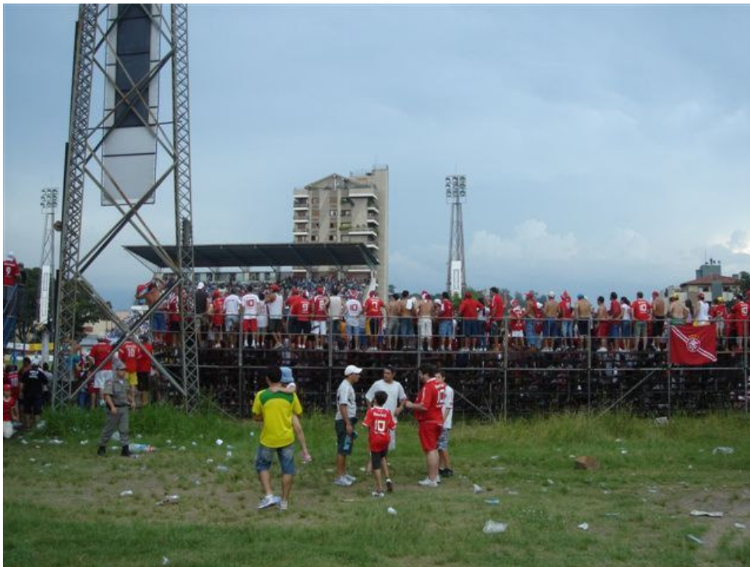
Novo Hamburgo (Brasil), març del 2007 / Julià Guillamon.

rutilant, correspon al Campionat del Món de Clubs que va aconseguir el mes de desembre passat davant del Futbol Club Barcelona. L'altre equip de la ciutat, el Grêmio, va guanyar la Copa del Món de 1983. A la cua per entrar a l'Estadio de Santa Rosa, a Novo Hamburgo, hi ha molta gent amb samarretes amb lletres japoneses de parc temàtic, planisferis i la inscripció: Campeão do Mundo FIFA . Remarquen la paraula FIFA : «No com el Grêmio, que va guanyar la Copa Toyota, un trofeu no homologat». Novo Hamburgo és una ciutat de colonització alemanya, al nord de Porto Alegre, amb una important indústria del calçat. Avui es juga la vuitena jornada del Campeonato Gaúcho, i alguns milers d'afecionats de l'Inter esperen per ocupar el seu lloc a les tribunes de tubs. És un retorn als orígens del futbol: un estadi desmanegat, però amb la gespa regular, un tros de camp amb tanques, sobrevolat per eixams d'espiadimonis. A la majoria dels europeus els sorprèn que els equips brasilers es passin dos mesos l'any jugant campionats locals en camps de barriada. Vist de prop, val la pena. El Novo Hamburgo s'avança en una rematada de córner. Al minut vuitanta-cinc empata Jean i al noranta-u un gol de Gabirú consuma la remuntada.